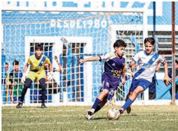
Na categoria Sub-14, Independente e Juventude Valinhos empataram e pelo placar de 1 a 1

em campo, no último domingo, 29 de junho, pelas categorias Sub-12, Sub-14 e Sub-16. A rodada foi positiva para os bragantinos, que conquistaram duas vitórias e um empate.