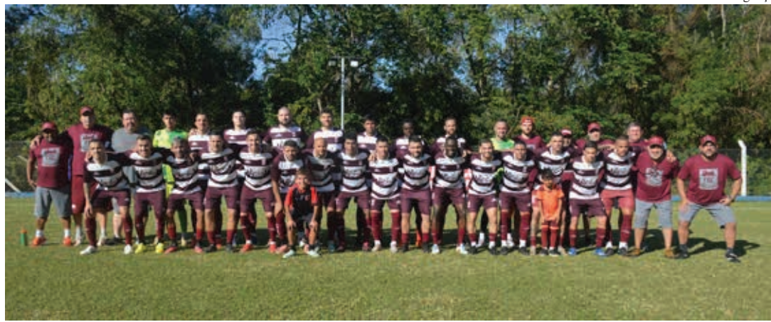
Ferroviários é campeão invicto do Amadorzão 2025