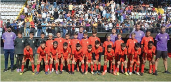
Real Bragança, vice-campeão da categoria Sub-11