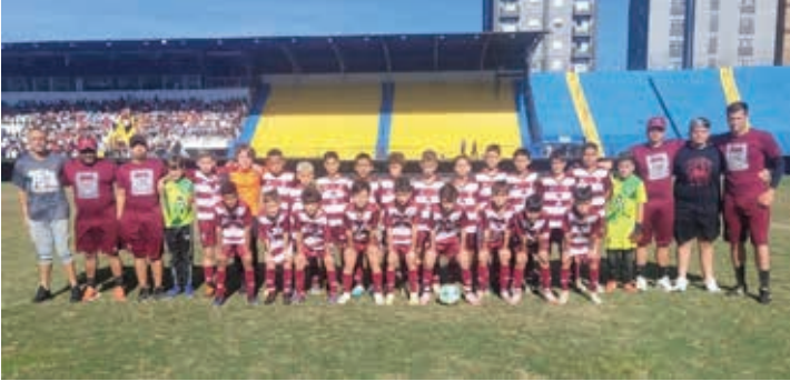
Ferroviários, campeão da categoria Sub-11