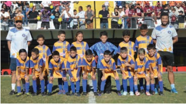
Legionários, vice-campeão da categoria Sub-9