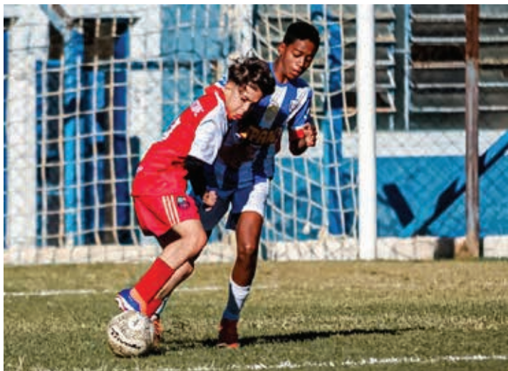
O time do Independente F. C. venceu o S. E. Juventude Valinhos por 2 a 0, na categoria Sub-12

As equipes Independente Futebol Clube e Associação de Futebol Real Brasil, representantes de Bragança Paulista na 12ª edição da Copa Monte Alegreense de Futebol de Base, entraram