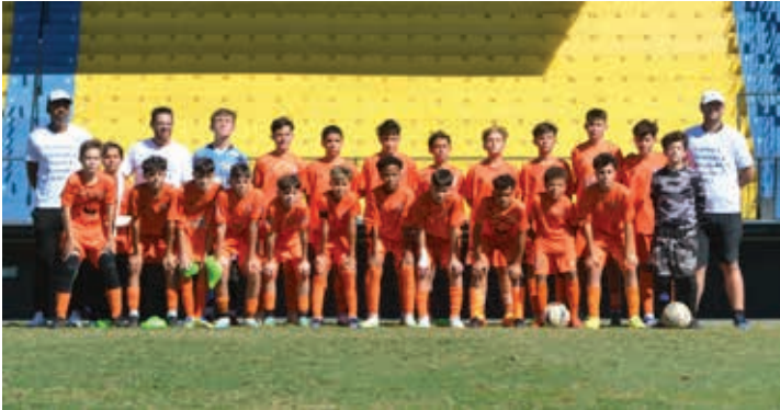
Lite Soccer/Vila Aparecida, vice-campeão da categoria Sub-13

Um grande público compareceu na manhã do último domingo, 29, ao Estádio Nabi Abi Chedid – o eterno Marcelão – em Bragança Paulista, para acompanhar o encerramento do tradicional Campeonato Municipal de Futebol de Menores. A competição é organizada pela Liga Bragantina de Futebol, em parceria com a Secretaria Municipal da Juventude, Esportes e Lazer (Semjel).