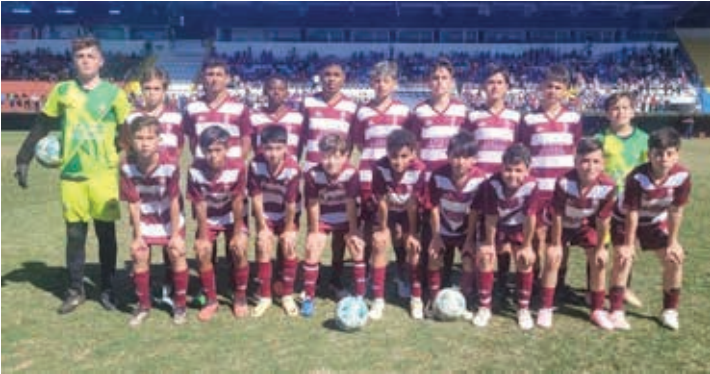
Ferroviários, campeão da categoria Sub-13