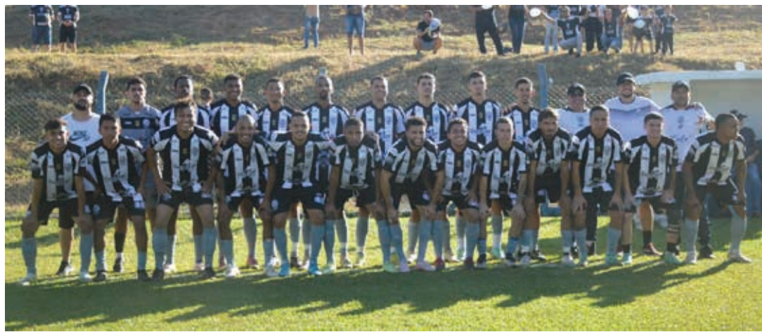
Campinho fica com o vice-campeonato da Série A do Amador