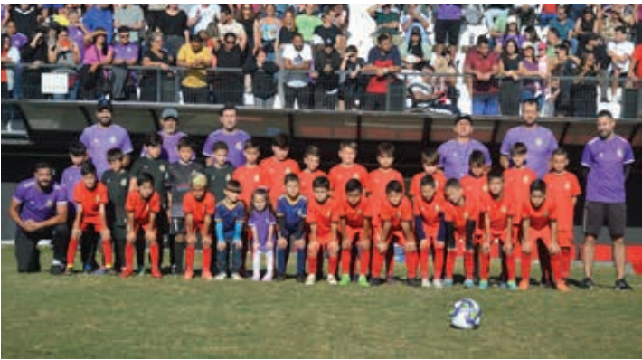
Real Bragança, campeão da categoria Sub-9